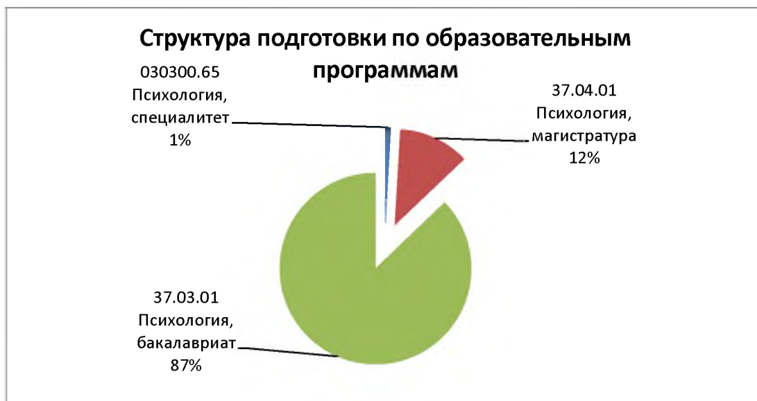
Рис. 3.3.1. Структура подготовки по ООП